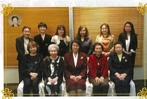
新年会(令和2年1月22日)

これからも女性や女児の為、恵まれない人々の為に、会員一同、精一杯頑張っているつもりでございます。今後共どうぞ、暖かいご支援と、ご協力をお願い申し上げます。