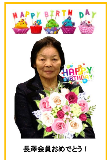
長澤会員おめでとう！